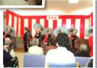
施設長からの歌のプレゼントや長寿のお祝も