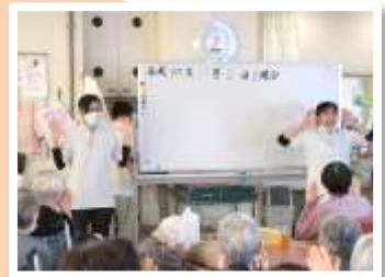
学生企画のレクリエーションの様子

今年の5月から11月にかけて、介護福祉士養成校の学生、看護学校の学生、高校生の職業体験などたくさんの学生が当苑に来られ、ご利用者の皆さまからたくさんのことを学ばせていただいております。福祉の仕事の魅力が次世代にも広がるよう、これからも各学校との繋がりを深めていきたいと思っております。