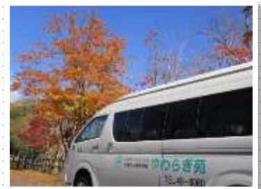
大沼・道の駅・しゃぶしゃぶ など…様々な場所で皆様の笑顔を見ることができました