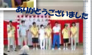
行事食も好評で、大盛況の行事となりました