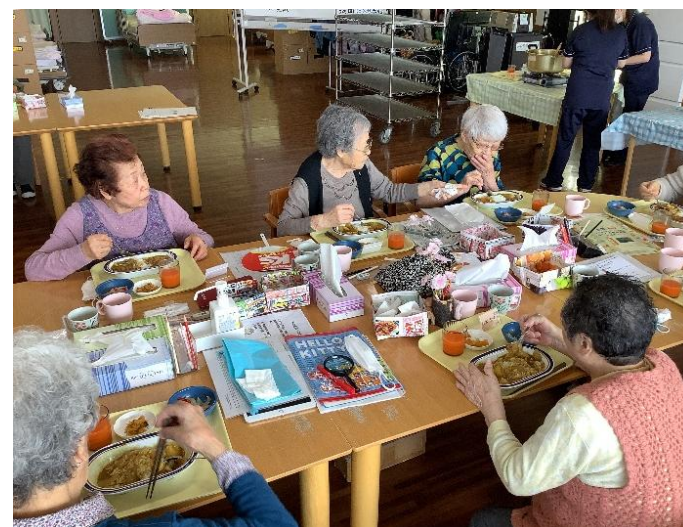
【3月22日 カレーライス作り】