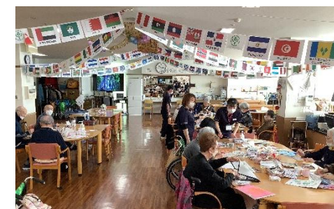
【土曜クラブの様子(絵葉書)】

毎月土曜日にはいろいろな活動をしています。五月にはソフトクリームを食べに行き、買い物レクを行いました。八月には和太鼓のボランティアの方に来てもらいました。大変感動したとの声もありました。昨年に引き続き土曜クラブも月に一回から三回の不定期ですが開催しております。