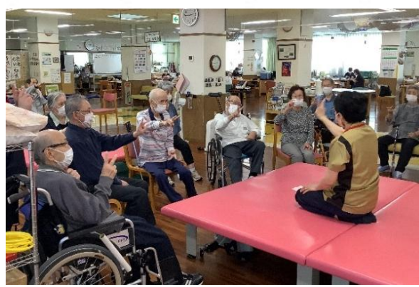
【リハビリによる集団体操】