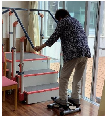
【自主トレーニング】