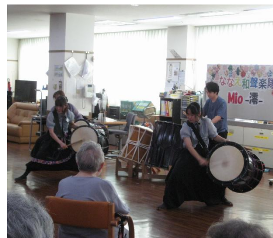
【8月23日 ななえ和聲楽団 mio 滞様による演奏】